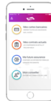
Notre application BtoC